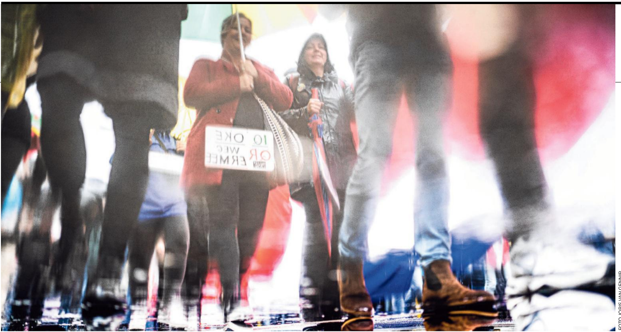
Protestmars in Amsterdam tegen coronamaatregelen.